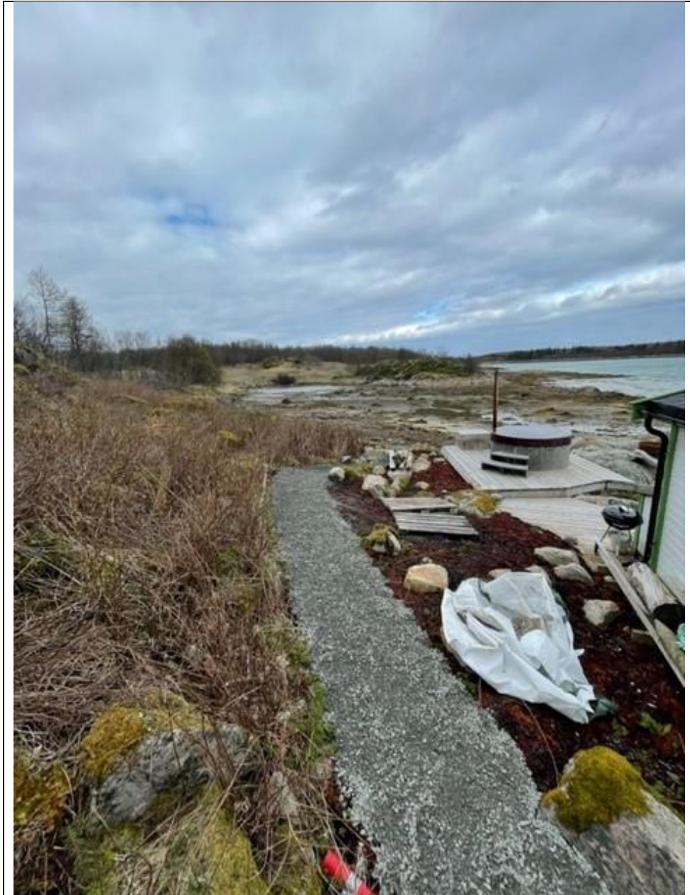
Illustrasjon som viser opparbeidet sti på baksiden av saunaen i dag.