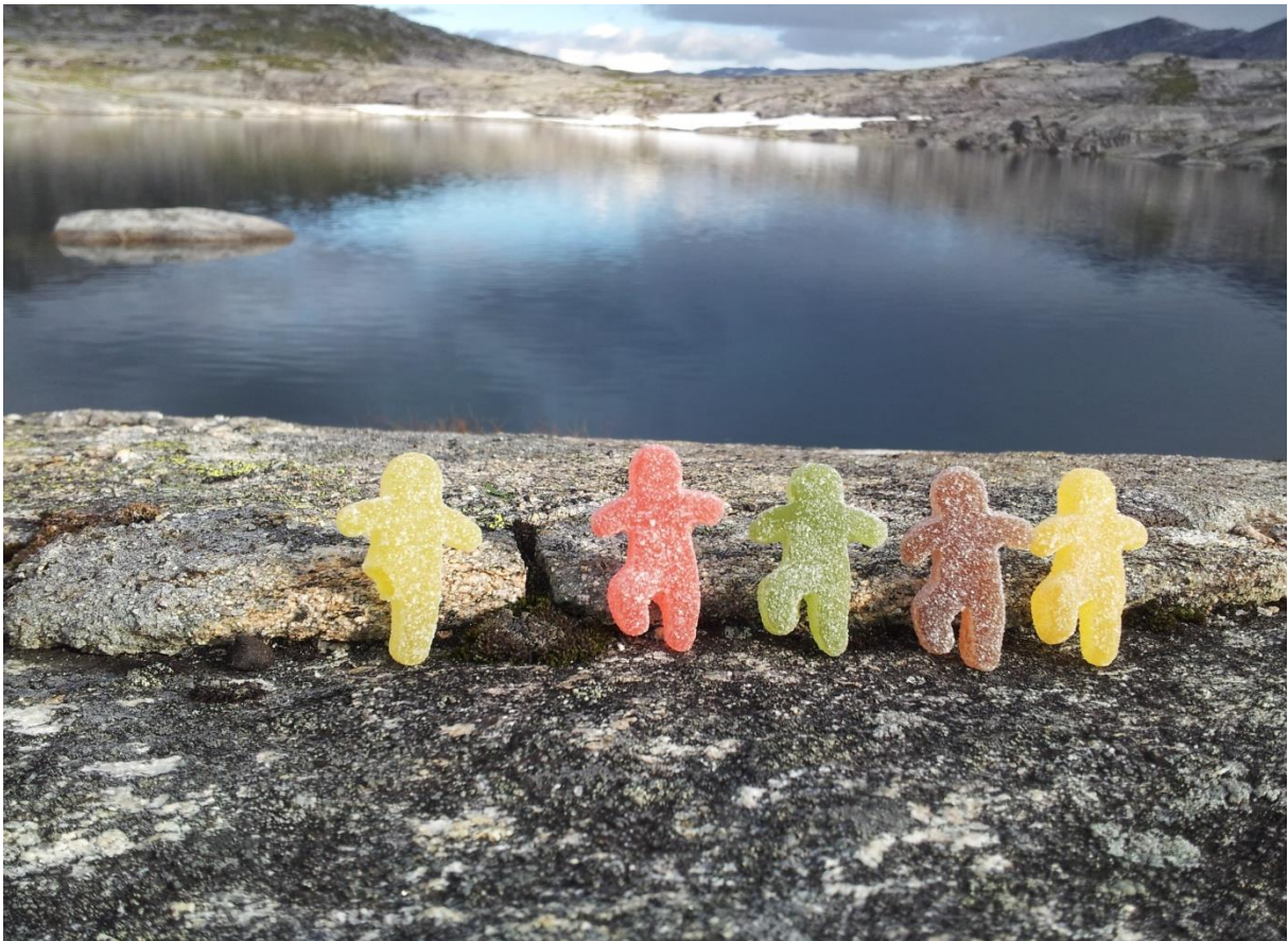
Steigen - kyst som gir lyst!

med planprogram for kommuneplanens samfunnsdel 2020-2032