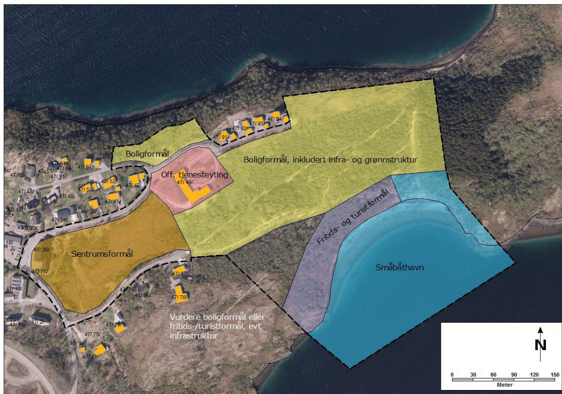
Avgrensning av planområdet og endringer i arealbruk som vil bli vurdert i planarbeidet.