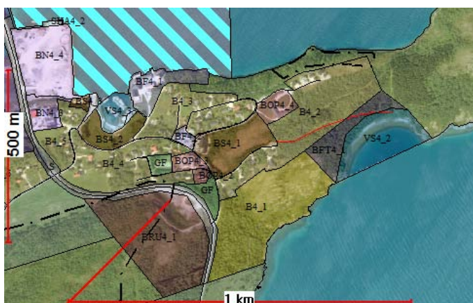
Utsnitt fra høringsforslag til kommuneplanens arealdel.

I forslag til kommuneplanens arealdel, som var på høring med frist 01.10.15, er arealene i planområdet vist til sentrumsformål, offentlig tjenesteyting, boligformål, fritids- og turistformål, småbåthavn og LNFR-formål. Ved høring av kommuneplanens arealdel, ble det varslet innsigelse mot småbåthavn og fritids- og turistformål i den søndre Jensvika. Plan- og ressursutvalget vedtok møte den 08.12.15 å ikke ta innsigelsen til følge og at det innledes samtaler/ forhandlinger med Fylkesmannen med sikte på at innsigelsen trekkes. Ved oppstart av arbeid med reguleringsplanen, tar vi utgangspunkt i at innsigelsen løses, og at det kan legges til rette for de nevnte formålene i området.