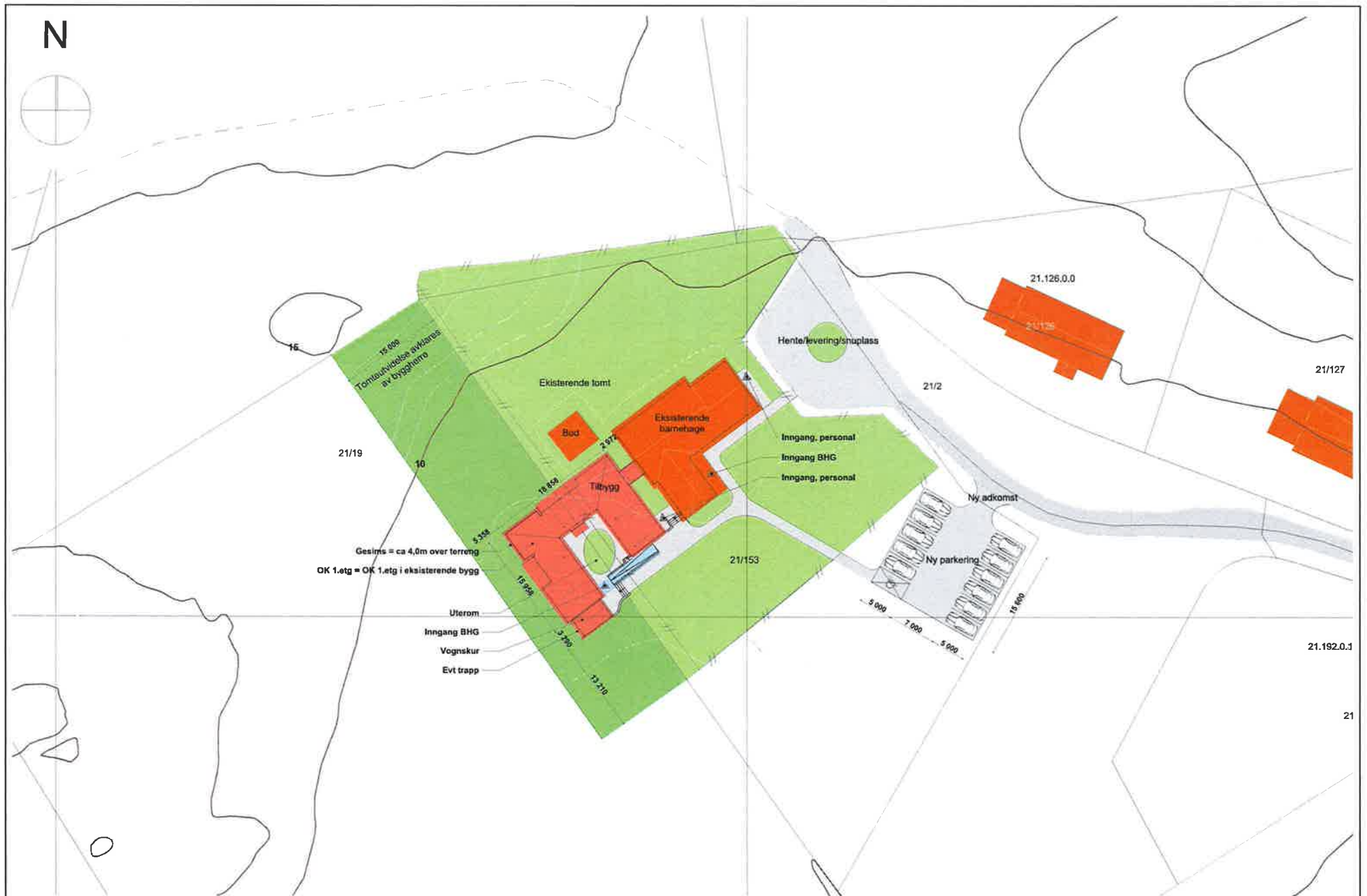
5135647 - Steigen Kommune - Utvidelse Leinesfjord BHG - Situasjonsplan - 02.09.2014 - 1:500 - Anbudstegning

Dette dokumentet er utarbeidet av Norconsult AS som del av det oppdraget som fremgår nedenfor. Opphavsretten tilhører Norconsult AS. Dokumentet må bare benyttes til det formål som oppdragsavtalen beskriver, og må ikke kopieres eller gjøres tilgjengelig på annen måte eller i større utstrækning enn formålet tilsier.